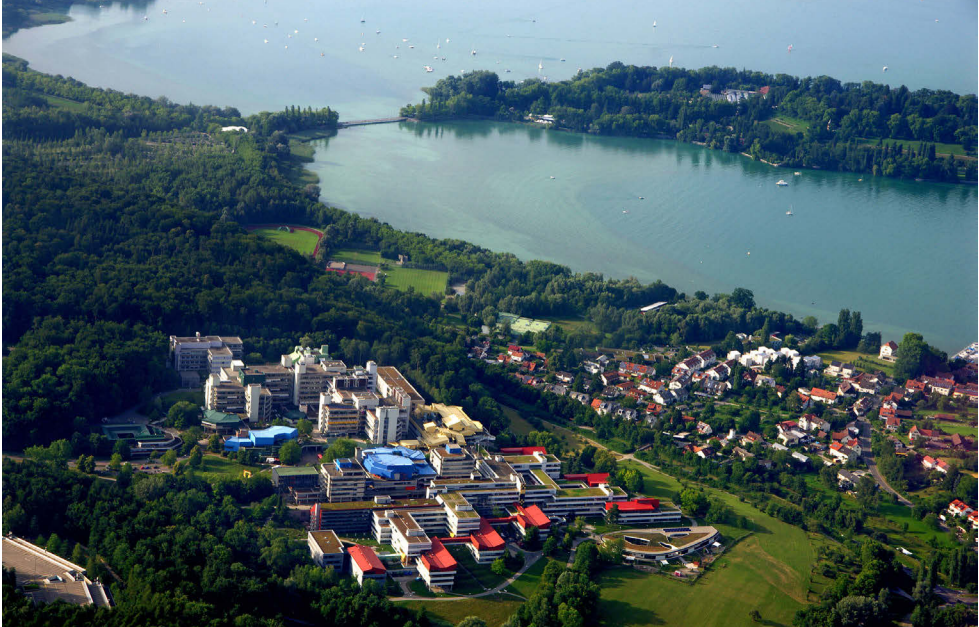
Abb. 1: Luftbild der Universität Konstanz

Seit November 2010 sind drei Viertel der Bibliotheksfläche aufgrund von Asbestfunden geschlossen. Während der seit 2011 laufenden Schadstoffsanierung wurden die betroffenen Gebäudeteile bis auf den Rohbau zurückgebaut und damit alle asbesthaltigen Bauteile entfernt. Der Wiederausbau soll mit der Fertigstellung der Gebäudeteile Info-Zentrum und BS im Frühjahr 2015 zu zwei Dritteln abgeschlossen sein, der dritte Gebäudeteil (BG) wird vermutlich im Jahr 2016 komplett saniert sein.