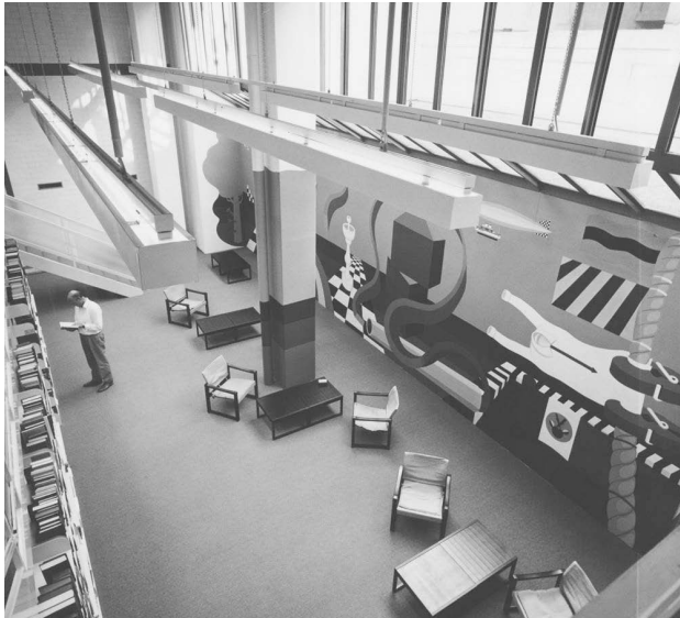
Abb. 2: Regalbereiche und Arbeitsplätze in der Bibliothek

Diese bewährte Konzeption wird auch nach der Sanierung weitgehend weitergeführt. Dennoch wird sich einiges gegenüber dem vorherigen Status verändern. So wird es grundsätzlich eine konsequente Trennung von lauten und leisen Bereichen geben. Das Info-Zentrum als zentrale Drehscheibe mit Haupteingang und -ausgang, Selbstausleihe und -rückgabe, Beratungsplätzen für bibliothekarische Information und universitären IT-Support, Schulungszone und Bibliothekscafé wird von den Buchbereichen, in denen es vorwiegend leise zugehen wird, klar abgetrennt sein.