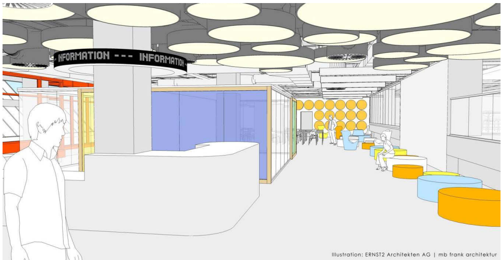
Abb. 3: Gemeinsame Beratung durch bibliothekarische Information und IT-Support