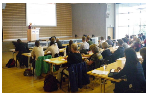
Abb.1: Zu Gast in der Deutschen Nationalbibliothek.