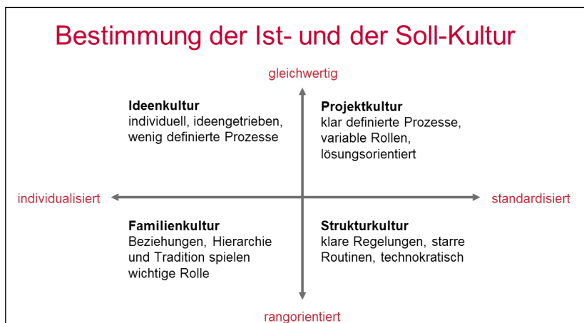
Abb. 2: Bestimmung der Ist- und der Soll-Kultur. Quelle: Graemer Development 7

Dem Teilprojekt „Entwicklung der Organisationskultur“ kommt insofern eine besondere Relevanz zu, als die Organisationskultur wohl als letztlich entscheidender Faktor jedes Unternehmens anzusehen ist. 6 Obwohl die Änderung der Organisationskultur ein vielschichtiges und schwieriges Unterfangen ist, scheint die Kulturarbeit aus Sicht der UB Mainz dennoch lohnenswert und unerlässlich. Um einen guten Ausgangspunkt zu finden, haben wir besondere Sorgfalt auf die Analyse unserer Organisationskultur verwandt. Dabei orientierten wir uns an dem Competing Values Framework, einem Modell der Organisationskulturstile, das vier Kulturtypen identifiziert. Auf Basis eines Quadranten-Systems (s. Abbildung 2) sind auf der horizontalen Achse die individualisierte bzw. standardisierte Ausprägung und auf der vertikalen Achse die gleichwertige bzw. rangorientierte Ausprägung dargestellt und in die verschiedenen Kulturen – Ideenkultur, Projektkultur, Strukturkultur und Familienkultur – übersetzt.