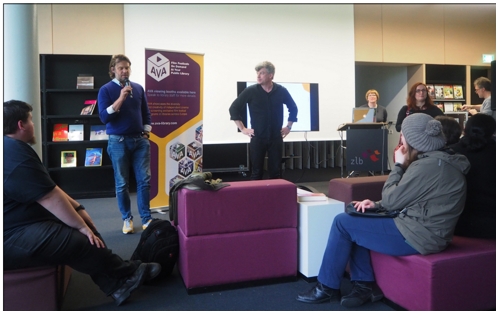
Abb. 2: Foto des AVA Projektlaunchs in der Zentral- und Landesbibliothek Berlin.

Das Projekt AVA wurde in der Pilotphase durch das Creative Europe MEDIA-Programm der Europäischen Union zunächst für die Dauer eines Jahres von 2016-2017 gefördert. Eine Anschlussförderung wurde im August 2017 für 2017-2018 bewilligt.