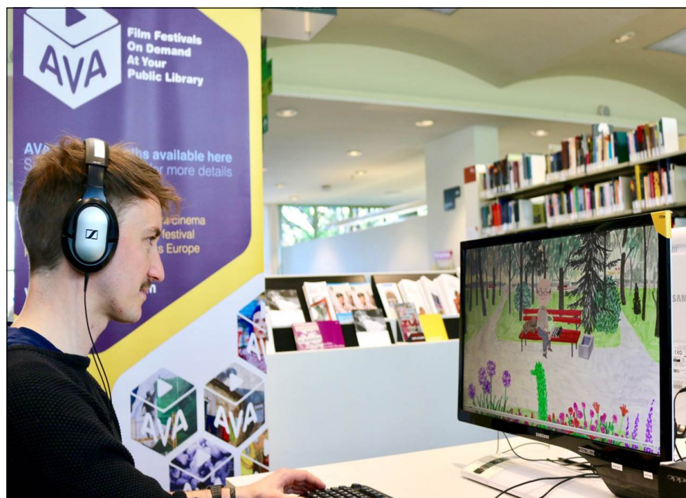
Abb. 1: AVA Sichtungsplatz in der Zentral- und Landesbibliothek Berlin.

Eingangs stellte Eva Kietzmann das Projekt Audio Visual Access (AVA) an der Zentral- und Landesbibliothek Berlin (ZLB) vor. 4 Das Projekt AVA zielt darauf, Kurzfilme europäischer Filmfestivals nach dem Ende des Festivals für einen befristeten Zeitraum in der örtlichen öffentlichen Bibliothek als Video-Stream on-site zugänglich zu machen.