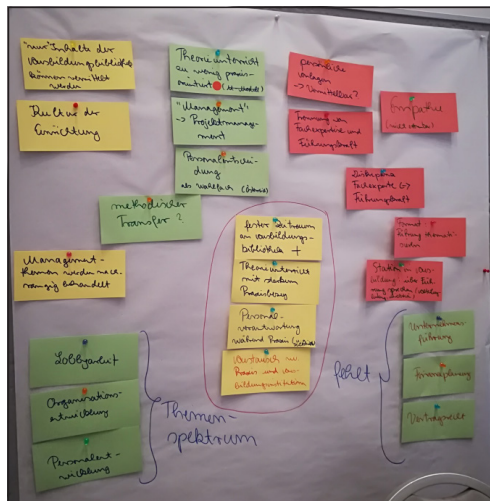
Abb. 1: Ergebnisse des Thementisches „Management“.