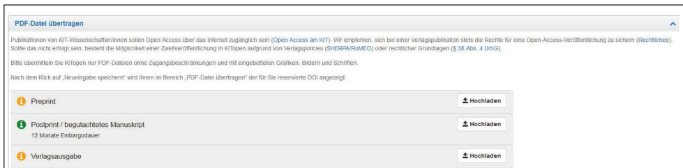
Abb. 2: Bewerbung eines Postprint nach dem Zweitveröffentlichungsrecht.

Die automatische Nutzerführung in KITopen bietet noch weitere Komponenten, die in vielen Fällen die Einblendung einer grünen Ampel ermöglicht und somit Open Access befördern: