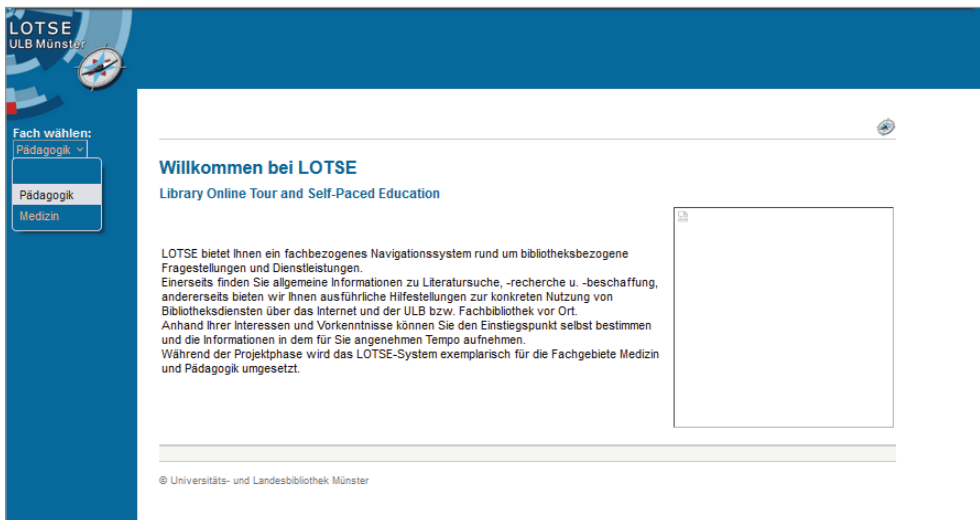
Abbildung 1: LOTSE-Seite vom 11.02.2003, weiterhin einsehbar in der Wayback Machine unter archive.org: https://web.archive.org/web/20030211142144/http://lotse.uni-muenster.de/

Viele der damals veröffentlichten Artikel sind auch heute noch in LOTSE in einer aktualisierten Form zu finden (z.B. Kataloge, Bibliographien, Suchmaschinen, Kontakte finden und pflegen, Auf dem Laufenden bleiben, Fakten finden). Der Anspruch von LOTSE ist damals wie heute, eine Auswahl wichtiger Links anzubieten, anstatt möglichst vollständig alle Links zu einem Thema aufzulisten.