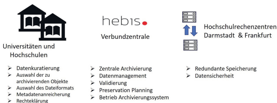
Abb. 1: Verteilte Infrastruktur in LaVaH

An den beteiligten Einrichtungen sind lokale Datenkurator*innen dafür zuständig, die Daten, v.a. Texte und Digitalisate, aber auch Audio- und Videomaterialien für die Aufnahme in das Langzeitarchiv vorzubereiten. Diese Vorbereitungsphase (Pre-Ingest) beinhaltet auch die Auswahl der zu archivierenden Daten. Dies geschieht gemeinsam mit den Leitungen der Institution und wird beratend durch die hebis Verbundzentrale begleitet. Die ausgewählten Daten müssen die rechtliche Voraussetzung für eine langfristige Speicherung mitbringen. Die Datenkurator*innen entscheiden, in welchen Dateiformaten die Daten geliefert werden. Des Weiteren kümmern sie sich um die Metadaten. In der Regel sind zu den Objekten bereits Metadaten vorhanden, die teilweise oder ganz übernommen werden können und um spezifische LZA-Metadaten ergänzt werden. Die Metadaten und Daten müssen in abgestimmter Form abgeliefert werden. Im Detail wird das gemeinsam mit der hebis Verbundzentrale entschieden, damit die Datenpakete mit den Vorgaben des Archivsystems kompatibel sind.