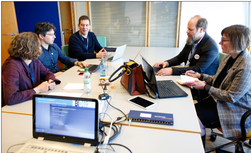
Abb. 2: Wie andere Kommissionen des VDB nutzte auch die neugegründete Kommission für forschungsnahe Dienste den Leipziger Kongress für eine interne Arbeitssitzung.

Die gemeinsame Baukommission von VDB und dbv führte am 10.4.2018 eine Fortbildung zum Thema „Wie arbeiten wir in Zukunft?“ an der KIT-Bibliothek in Karlsruhe durch. Auf dem Bibliothekskongress 2019 bot sie eine Informationsveranstaltung zum Bibliotheksbau an. Außerdem ist 2019 eine Exkursion in die Niederlande geplant (Rotterdam und Delft). Daneben hat sich die Kommission mit mehreren Fachanfragen beschäftigt und unterstützte bei einem Wettbewerb (Leibniz-Institut in Leipzig).